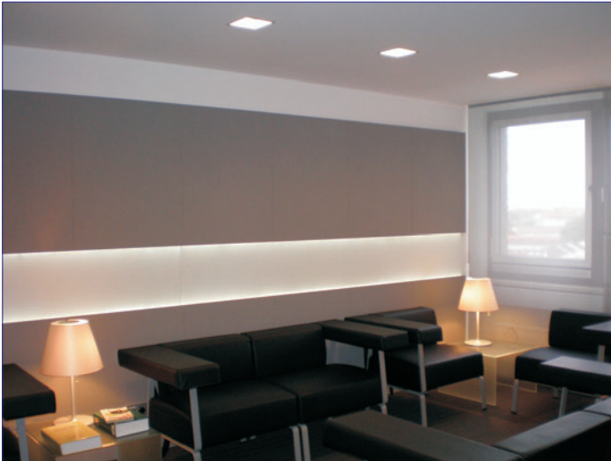
Wände und Decken aus Gipskarton