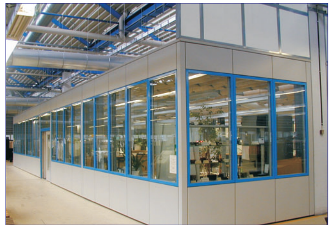
Schalldämmung und Schallabsorbierung zur Lärmberuhigung in Produktionsstätten