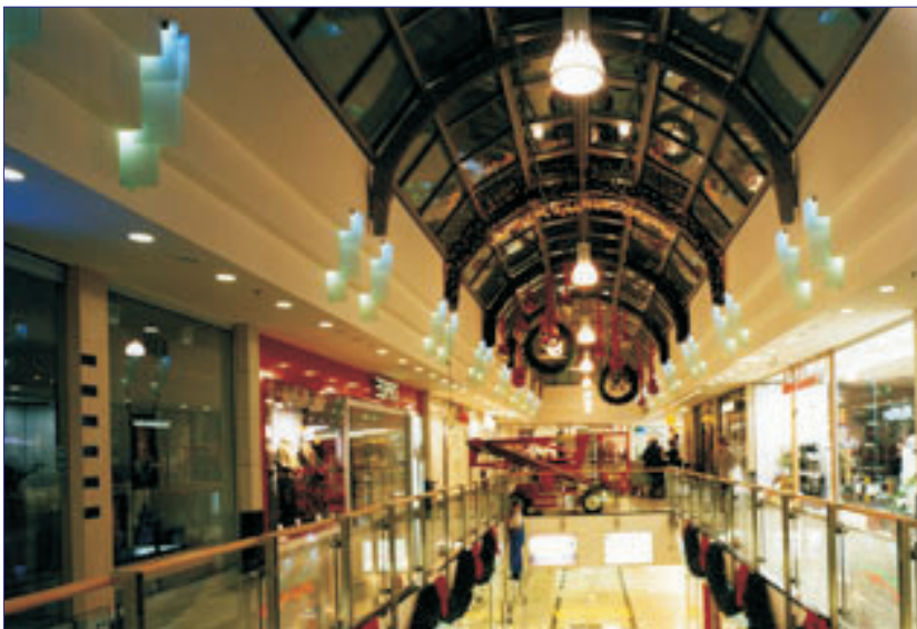
Variabel in der Ausführung