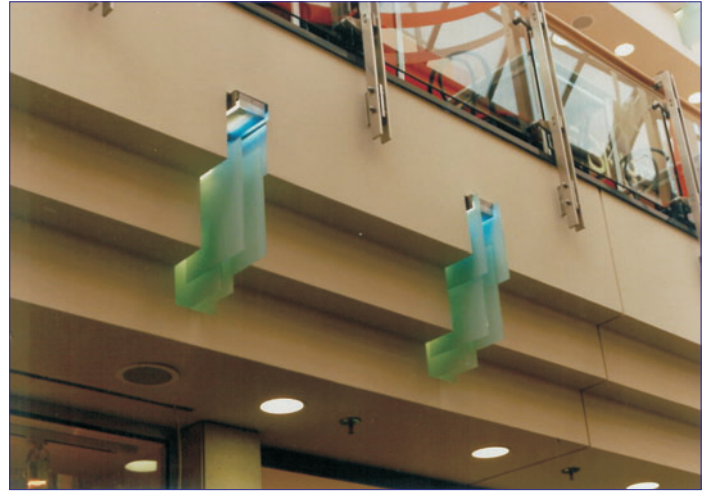
Abkofferungen und Stützenverkleidungen