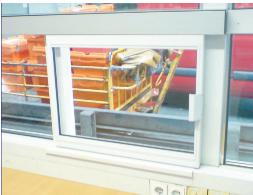
Schiebefenster (z.B. für Warenannahme oder Pforte)

Maßgeschneiderte Anfertigungen inkl. Lackierung und Einbau