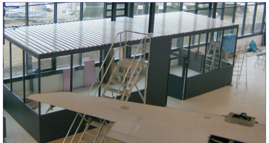
Optimal für die variable Gestaltung im Innenausbau