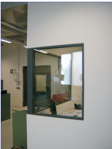
Wände mit Lichtausschnitten