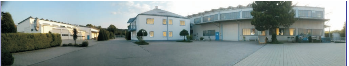
Unser Hauptbetrieb in Eichendorf (zwischen Dingolfing und Passau)

Der Hauptsitz unseres Betriebes ist in Eichendorf (Bayern). Unsere Niederlassung befindet sich in Mülsen (Sachsen). Wir sind im gesamten Bundesgebiet sowie im benachbarten Ausland tätig.